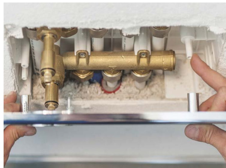
6. APPLICARE il coperchio a vista in modo che i perni della cassetta combacino con i fori del coperchio stesso.