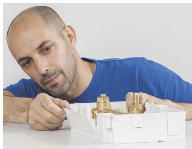
3. PREMERE sulla placchetta per asportarla e permettere il passaggio dei tubi.