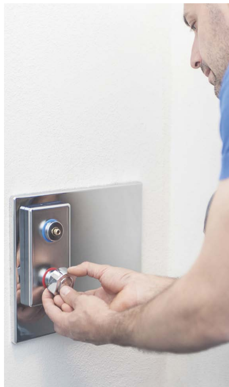
10. APPLICARE le manopole di intercettazione esercitando una leggera pressione.