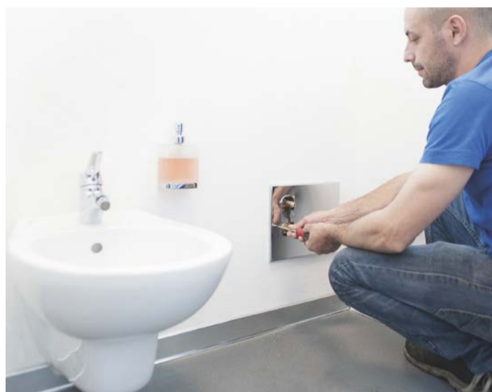
7. AVVITARE senza stringere a fondo, per evitare di piegare il coperchio.