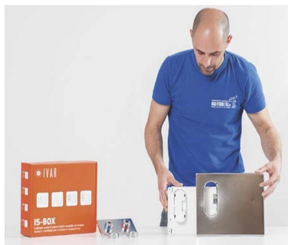
1. IL KIT IS-BOX , in questo caso nella versione completamente ispezionabile.