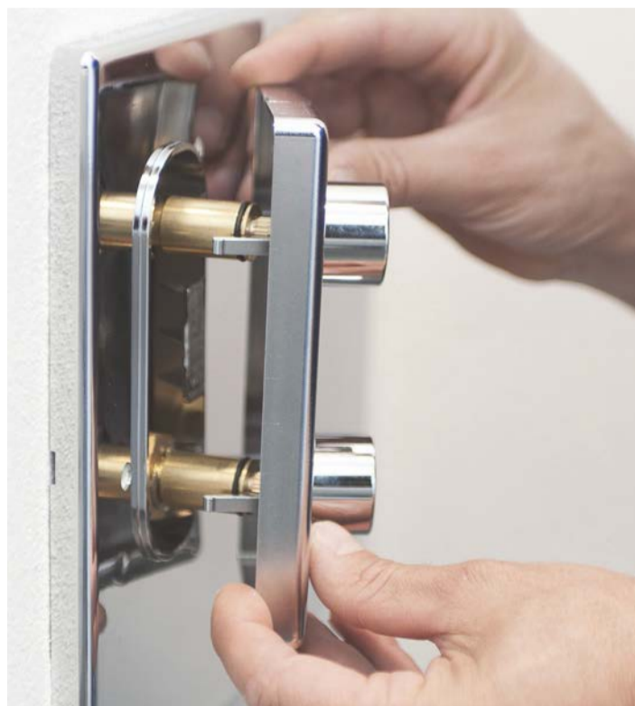
9. INSERIRE la piastra nell'apposito alloggiamento.