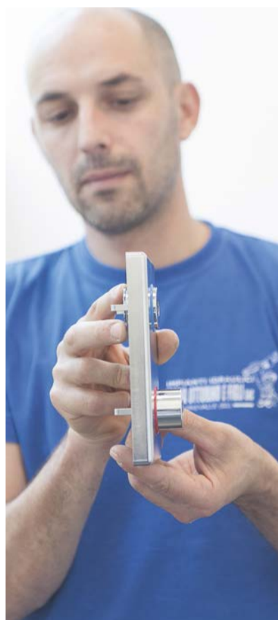
8. INSERIRE le guarnizioni rossa e blu sulla piastra di protezione per le valvole di intercettazione e i supporti per le relative monopole.