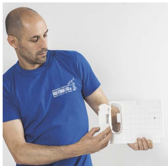
4. ASPORTARE anche la protezione per le valvole di intercettazione.